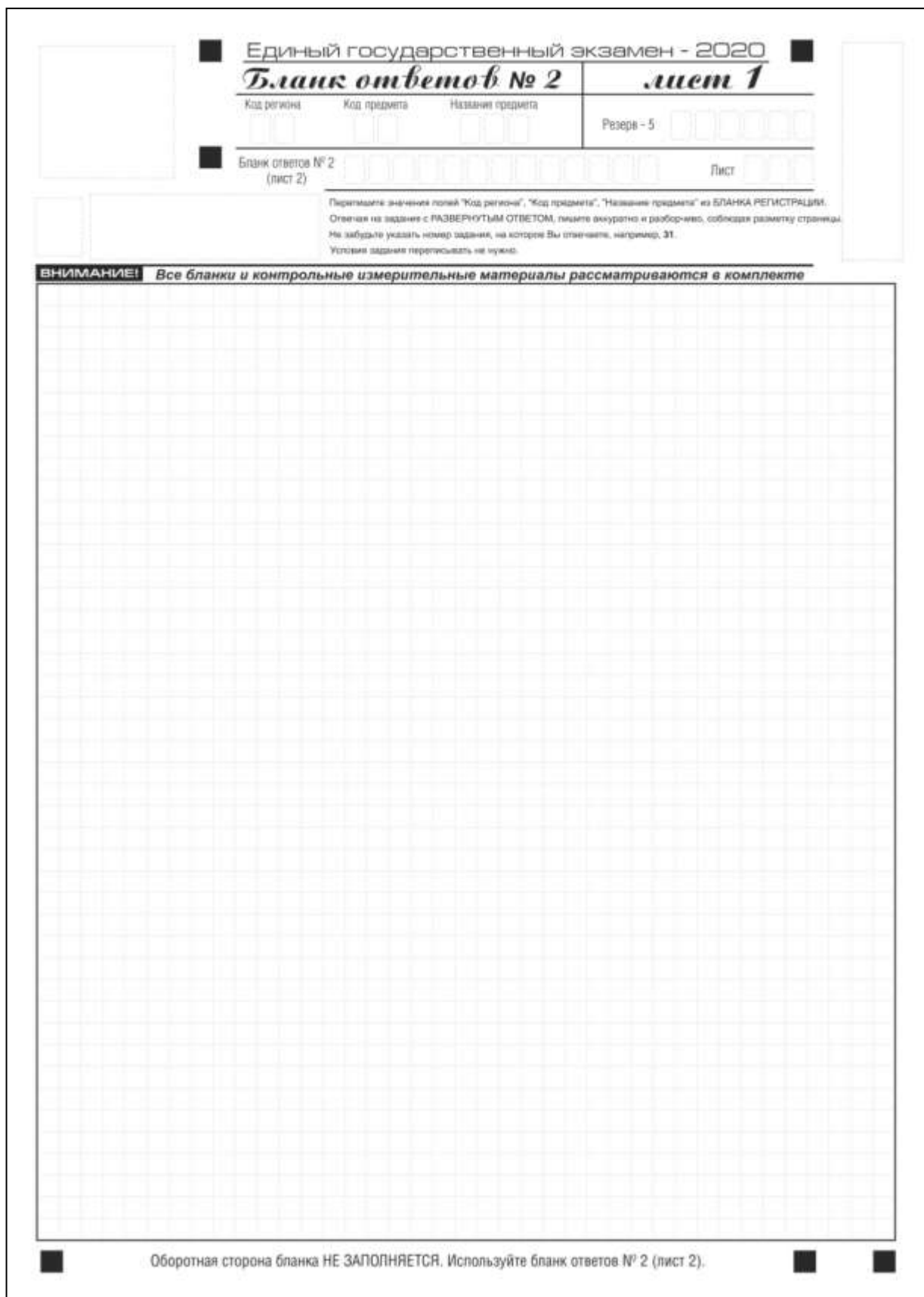
Рис. 10. Бланк ответов № 2 (лист 1)